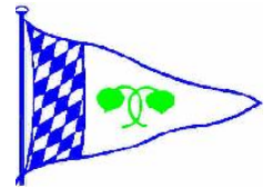
Tegernsee Touring Yachtclub